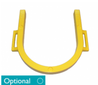
Přídavné závaží pro tříkotoučové stroje Cimex R48 HD a CR48 DF