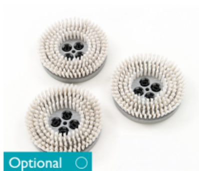
Diskový kartáč na koberce CIMEX CYCLONE CR 48 8" - 200mm (3ks)