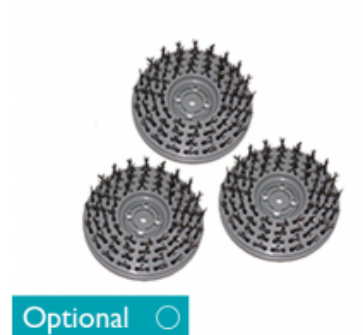
Diskový kartáč CIMEX CR48 HD a CR48 DF ocelový 3x16G 8" - 200mm (3ks)