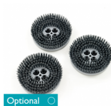
Diskový kartáč CIMEX CYCLONE CR 48 TYNEX 8" - 200mm (3ks)