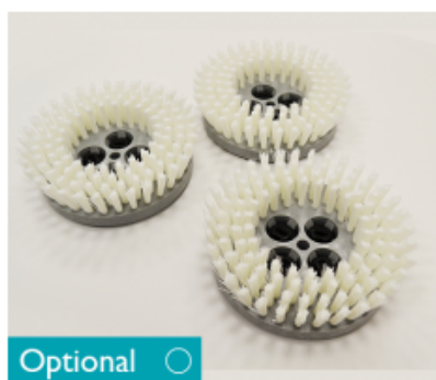
Diskový kartáč CIMEX CYCLONE CR 48 Nylon 8" - 200mm (3ks)