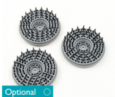
Diskový kartáč CIMEX CR48 HD a CR48 DF ocelový 3x18G 8" - 200mm (3ks)