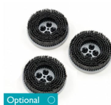
Diskový kartáč CIMEX CR48 HD a CR48 DF drátěný 8" - 200mm (3ks)