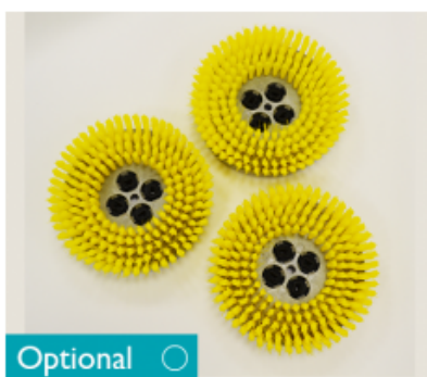
Diskový kartáč CIMEX CYCLONE CR 48 PPL 8" - 200mm (3ks)