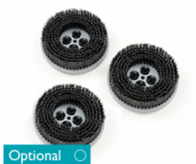
Diskový kartáč CIMEX CR48 HD a CR48 DF drátěný 8" - 200mm (3ks)