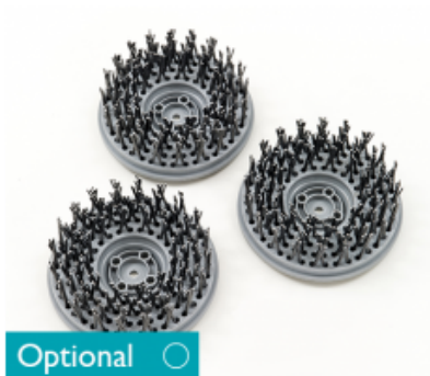
Diskový kartáč CIMEX CR48 HD a CR48 DF ocelový 3x14G 8" - 200mm (3ks)