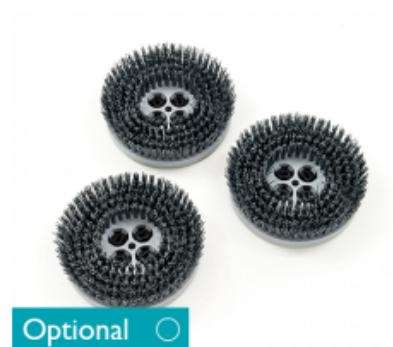
Diskový kartáč CIMEX CYCLONE CR 48 TYNEX 8" - 200mm (3ks)