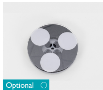
Unašec se suchým zipem pro diamantové kotouče CIMEX DIAMOND CR48 DF