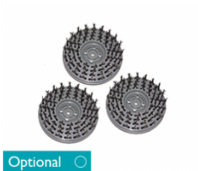
Diskový kartáč CIMEX CR48 HD a CR48 DF ocelový 3x16G 8" - 200mm (3ks)