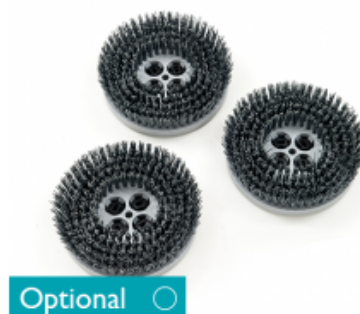
Diskový kartáč CIMEX CYCLONE CR 48 TYNEX 8" - 200mm (3ks)