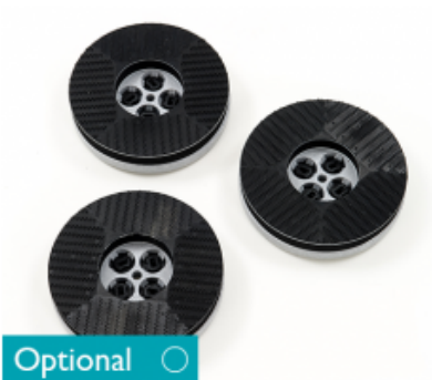
Unašeč padů CIMEX CYCLONE CR 48 8" - 200mm (3ks)