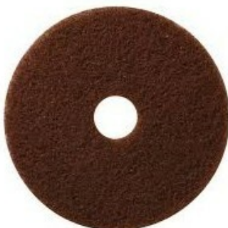
Podlahový PAD premium - hnědý 7,75" (200mm)