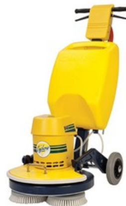
CIMEX CYCLONE CR 48 (19")