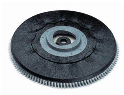
Držák padu se štětiniami Nilfisk 510mm (20")