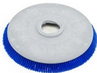
Diskový kartáč Nilfisk 530mm (21") - Prolene