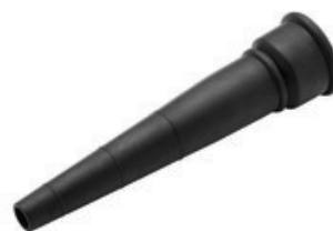
Adaptér na nářadí pro vysavače Nilfisk DN50/38