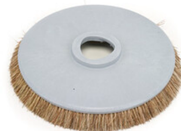
Diskový kartáč Nilfisk 530mm (21") - Union Mix