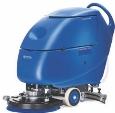
Nilfisk SCRUBTEC 553 E