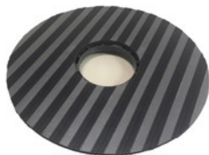
Držák padu plochý Nilfisk 508mm (20")