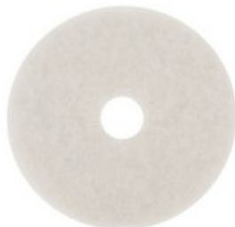
Podlahový PAD premium - bílý 20" (510mm)