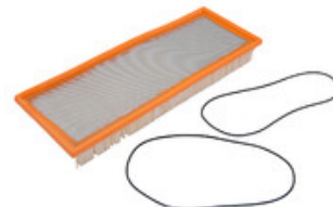
Polyesterový panelový filtr pro zametací stroje Nilfisk SW750 a Floortec 350