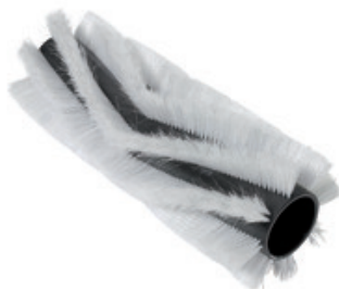
Hlavní válcový kartáč pro zametací stroje Nilfisk 200x500mm PPL 0,7