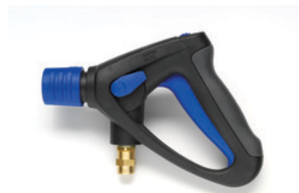
Nilfisk Ergo 2000 VarioPress - pistole