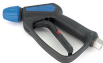
Vysokotlaká pistole pro vysoký průtok vody Nilfisk High Flow