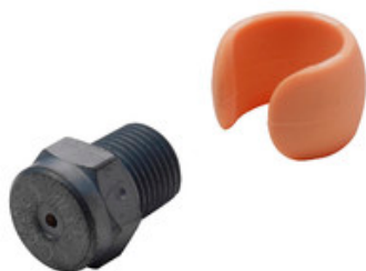
Vysokotlaká tryska Nilfisk Tornado Plus 1200