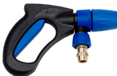
Nilfisk Ergo 3000 VarioPress - pistole s aretací