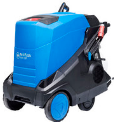
Nilfisk MH 8P-180/2000 FAX