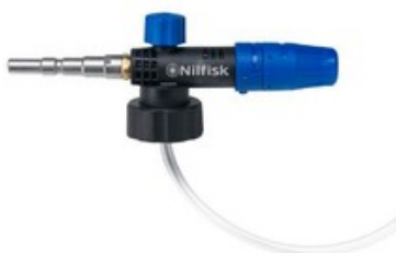
Nilfisk napěňovací nástavec Vario (960-1440 l/hod)