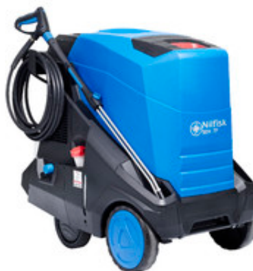
Nilfisk MH 7P-180/1260 FAX