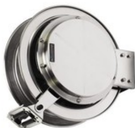
Nilfisk nerezový samonavíjecí buben pro vysokotlakou hadici