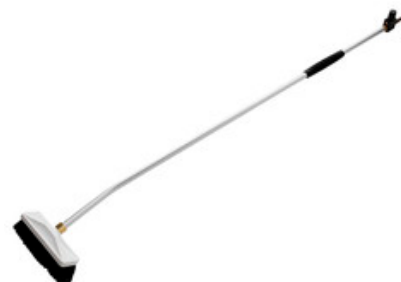
Nilfisk průtočný mycí kartáč s nástavcem 2350mm