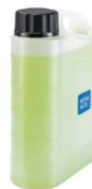
Nádobka pro napěňovací nástavec Nilfisk Vario (2,5L)