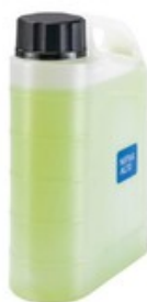
Nádobka pro napěňovací nástavec Nilfisk Vario (2,5L)