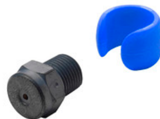
Vysokotlaká tryska Nilfisk Tornado Plus 0475