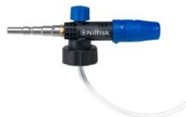
Nilfisk napěňovací nástavec Vario (960-1440 l/hod)