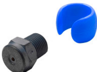
Vysokotlaká tryska Nilfisk Tornado Plus 0475