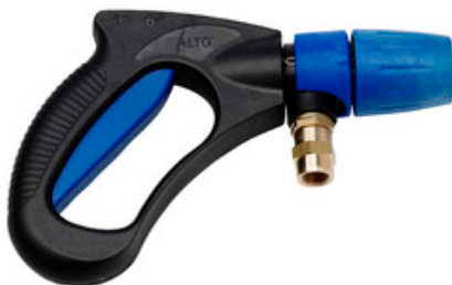
Nilfisk Ergo 3000 - pistole s aretačí