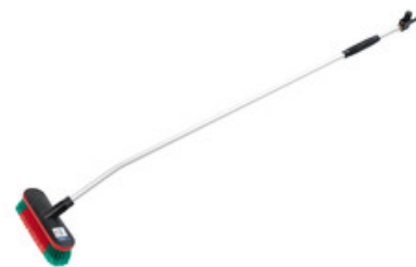
Nilfisk průtočný mycí kartáč s nástavcem 1550mm