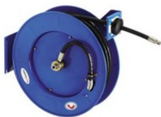
Nilfisk samonavíjecí buben pro vysokotlakou hadici