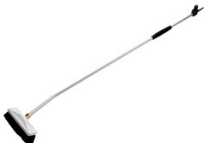
Nilfisk průtočný mycí kartáč s nástavcem 2350mm