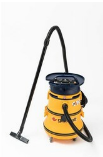
Gisowatt PC 50 Airtech Tools Self Cleaning Filter