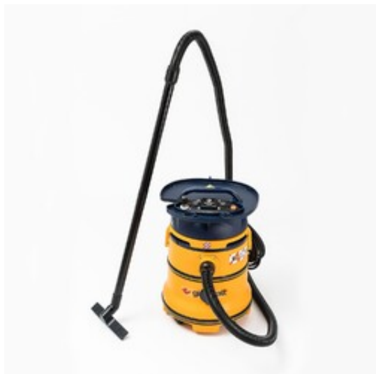
Gisowatt PC 35 Airtech Tools Self Cleaning Filter