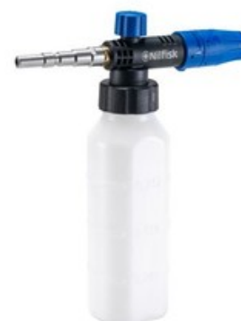
Nilfisk napěňovací nástavec Vario s nádobkou 1l (540-960 l/hod)