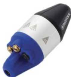
Vysokotlaká tryska Nilfisk 4-IN-1 ALU 0340