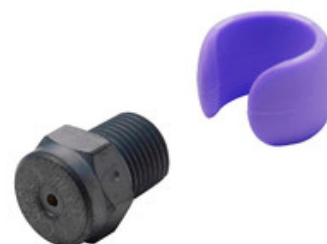
Vysokotlaká tryska Nilfisk Tornado Plus 0340