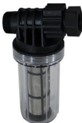
Filtr vstupní vody pro vysokotlaké čističe Nilfisk