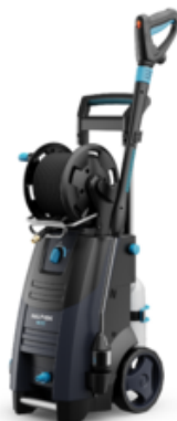
Nilfisk MC 2C-120/520 XT