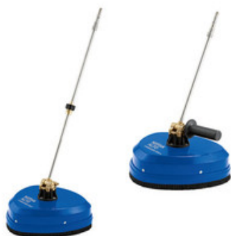
Rotační čistič svislých ploch i podlah Nilfisk HydroScrub P300 P+H