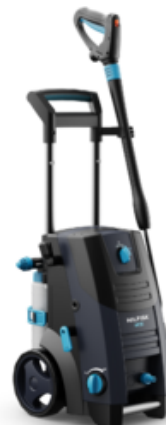
Nilfisk MC 2C-150/650