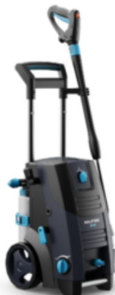
Nilfisk MC 2C-120/520 T