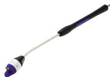
Nilfisk 4-IN-1 nástavec s tryskami 0340