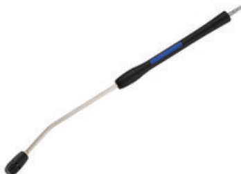
Nilfisk FlexoPower Plus nástavec - 960mm