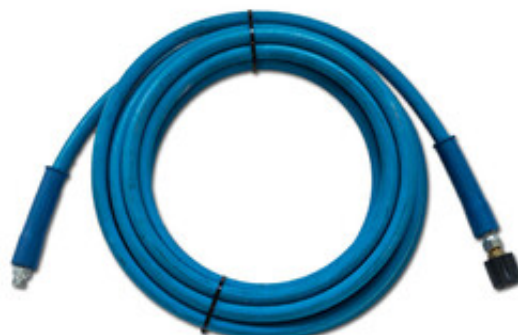
Vysokotlaká hadice Mazzoni R2 DN10x20m 3/8"M - M22x1,5