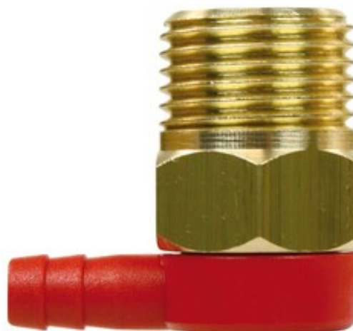
Pojistný termický ventil 1/2" M