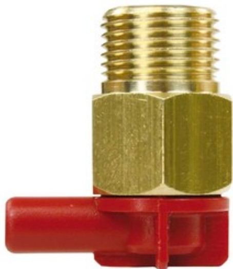
Pojistný termický ventil 3/8" M