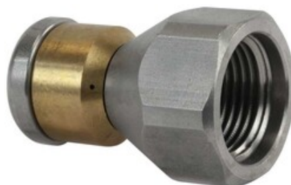
Vysokotlaká rotační kanalizační tryska 250bar 3/8" ST-49.1 (100)