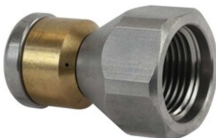
Vysokotlaká rotační kanalizační tryska 250bar 3/8" ST-49.1 (080)