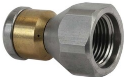
Vysokotlaká rotační kanalizační tryska 250bar 3/8" ST-49.1 (040)