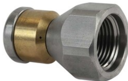
Vysokotlaká rotační kanalizační tryska 250bar 3/8" ST-49.1 (050)