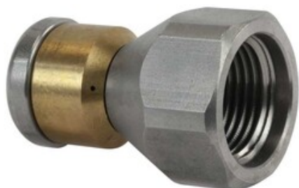
Vysokotlaká rotační kanalizační tryska 250bar 3/8" ST-49.1 (060)