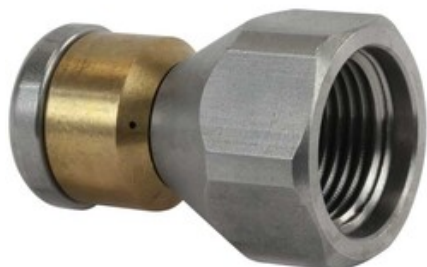
Vysokotlaká rotační kanalizační tryska 250bar 3/8" ST-49.1 (120)