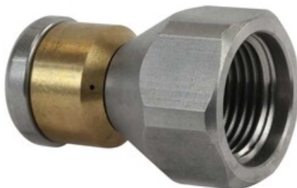
Vysokotlaká rotační kanalizační tryska 250bar 3/8" ST-49.1 (045)