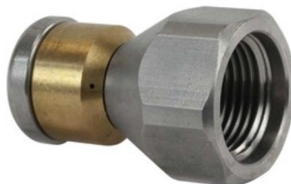
Vysokotlaká rotační kanalizační tryska 250bar 3/8" ST-49.1 (200)