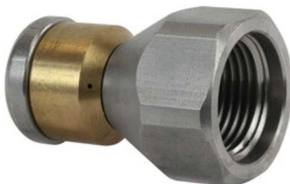
Vysokotlaká rotační kanalizační tryska 250bar 3/8" ST-49.1 (150)