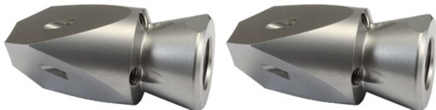
Vysokotlaká kanalizační tryska 350bar 1/4" ST-49 frézovací 4+4 (150) 50mm