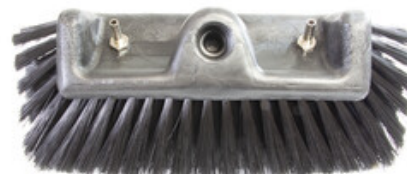
Mycí kartáč pro nízkotlaký teleskopický nástavec (1.90-10.00m)