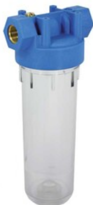
Vodní filtr vstupní pro vysokotlaké čističe 5" malý