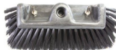
Mycí kartáč pro nízkotlaký teleskopický nástavec (1.90-10.00m)