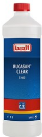
Buzil Bucasan Clear G 463 (1L)