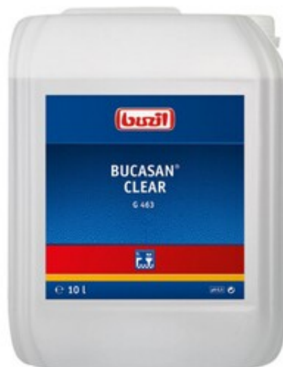
Buzil Bucasan Clear G 463 (10L)