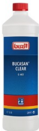
Buzil Bucasan Clear G 463 (1L)