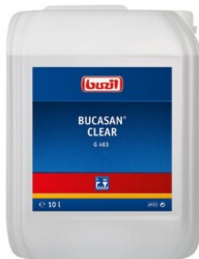
Buzil Bucasan Clear G 463 (10L)