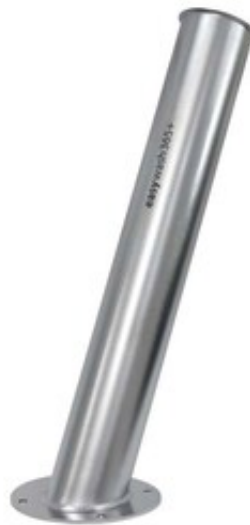
Držák vysokotlaké pistole do podlahy 730mm/100mm/20mm