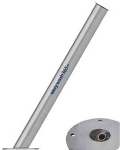
Držák vysokotlaké pistole do podlahy 730mm/60mm/20mm