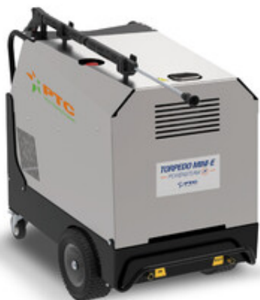
PTC Torpedo Mini-E 8/160