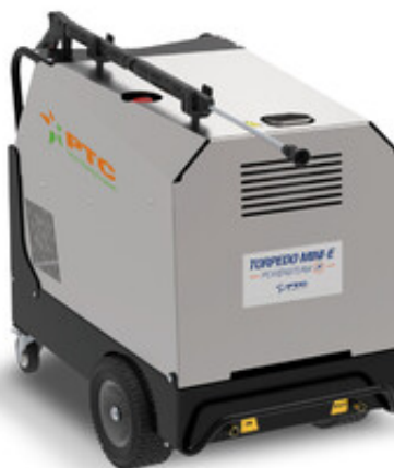
PTC Torpedo Mini-E 8/200