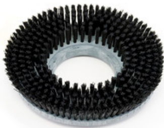
Diskový kartáč Nilfisk LUG 430mm (17") - Prolene