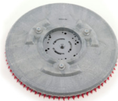
Držák padu Nilfisk 430mm (17") LUG