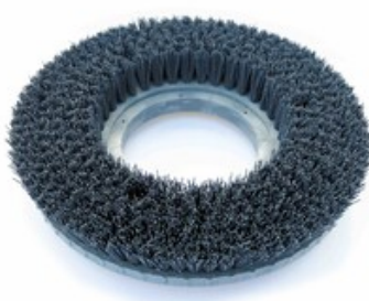
Diskový kartáč Nilfisk LUG 430mm (17") - Mid Grit 240