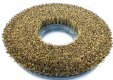
Diskový kartáč Nilfisk LUG 430mm (17") - Union Mix