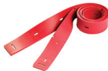
Stírací gummy do sací lišty pro podlahové mycí stroje Nilfisk 860mm linatex