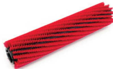
Válcový kartáč Nilfisk 810mm - Polypropylen red