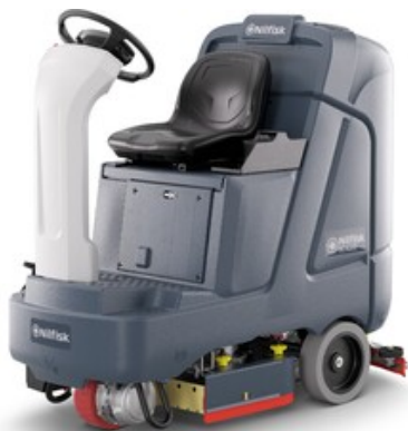
Nilfisk SC4000 710D