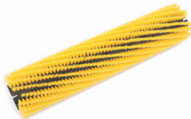
Válcový kartáč Nilfisk 810mm - Nylon soft yellow