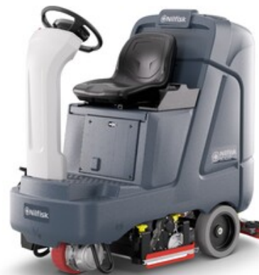
Nilfisk SC4000 710C