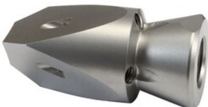
Vysokotlaká kanalizační tryska 350bar 1/4" ST-49 frézovací 4+4 (100) 50mm