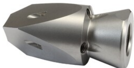
Vysokotlaká kanalizační tryska 350bar 1/4" ST-49 frézovací 4+4 (085) 50mm