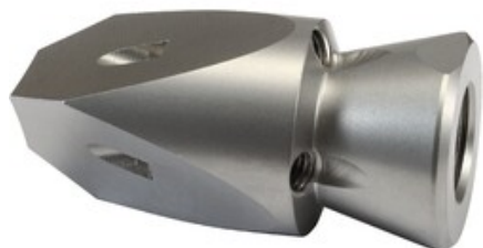
Vysokotlaká kanalizační tryska 350bar 1/4" ST-49 frézovací 4+4 (060) 50mm