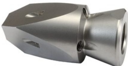
Vysokotlaká kanalizační tryska 350bar 1/4" ST-49 frézovací 4+3 (050) 50mm