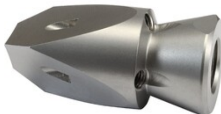
Vysokotlaká kanalizační tryska 350bar 1/4" ST-49 frézovací 4+3 (055) 50mm