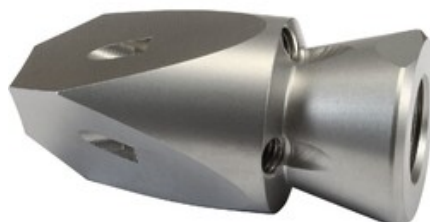
Vysokotlaká kanalizační tryska 350bar 1/4" ST-49 frézovací 4+4 (120) 50mm