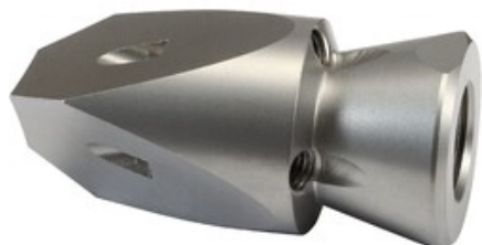
Vysokotlaká kanalizační tryska 350bar 1/4" ST-49 frézovací 4+3 (045) 50mm