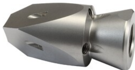
Vysokotlaká kanalizační tryska 350bar 1/4" ST-49 frézovací 4+4 (080) 50mm