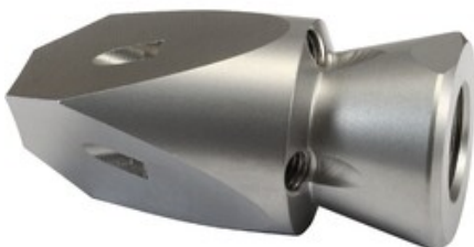
Vysokotlaká kanalizační tryska 350bar 1/4" ST-49 frézovací 4+4 (070) 50mm