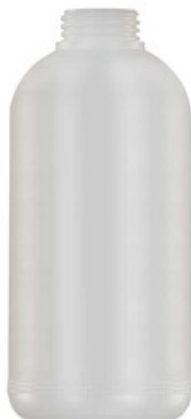
Nádobka pro napěnovací nástavec ST-73 (1L)