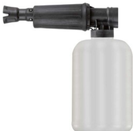
Napěnovací nástavec ST-73.1 s nádobkou 2l (tryska 2.10)