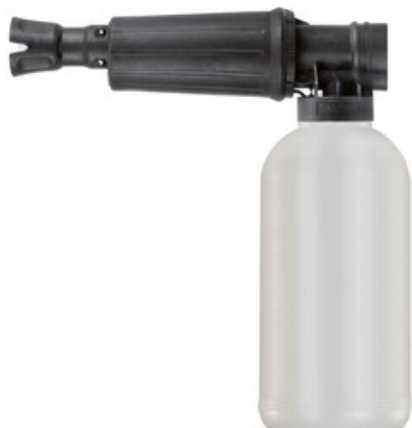
Napěnovací nástavec ST-73.1 s nádobkou 1l (tryska 1.25)