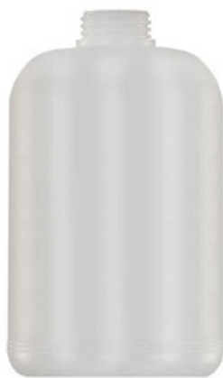
Nádobka pro napěnovací nástavec ST-73 (2L)