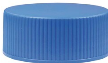
Víčko pro napěnovací nádobku nástavce ST-73