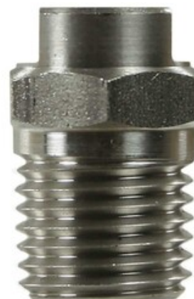
Vysokotlaká tryska plochá 1/4" 25020