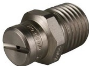
Vysokotlaká tryska plochá 1/4" 25045