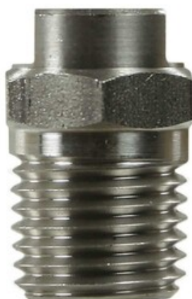
Vysokotlaká tryska plochá 1/4" 25085