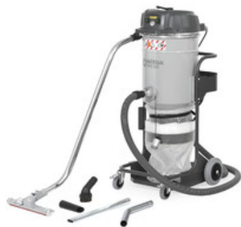
Nilfisk VHS120 All-In-One B&C