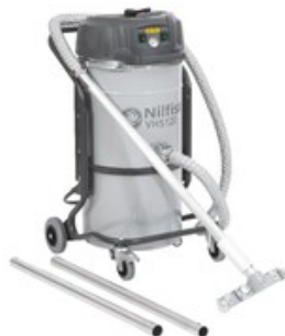
Nilfisk VHS120 All-In-One Bakery