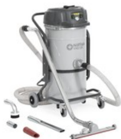
Nilfisk VHS120 All-In-One General Cleaning