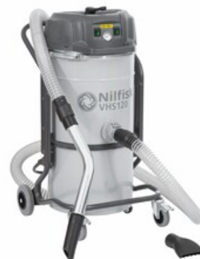
Nilfisk VHS120 All-In-One Metal Chips