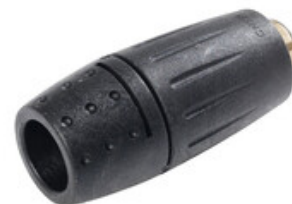
Hlavice vysokotlaké trysky Nilfisk Wap FlexoPower 1/4" F