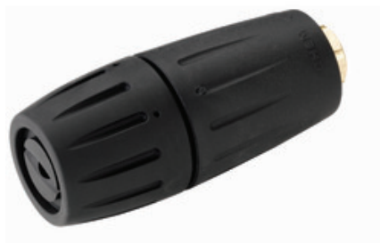
Hlavice vysokotlaké trysky Nilfisk FlexoPower 1/4" F