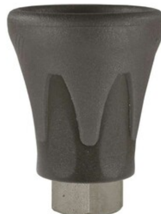
Držák vysokotlaké trysky 1/4" F - 500bar