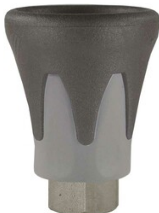
Držák vysokotlaké trysky 1/8" F - 500bar