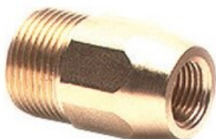
Vysokotlaké šroubení M22x1.5 - 1/4"F Mazzoni