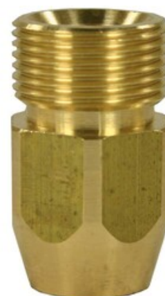
Vysokotlaké šroubení M22x1.5 - 1/4"F Kränzle