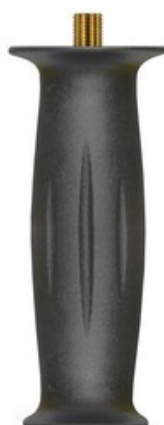
Rukojeť pro vysokotlaké nástavce s plastovou ochranou ST-9