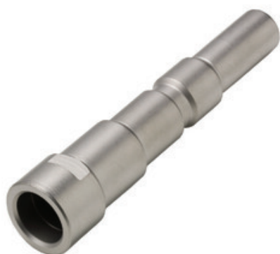
Rychlospojka pro připojení vysokotlaké pistole Nilfisk 1/4" F