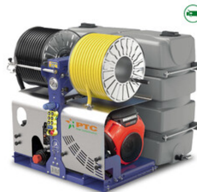
PTC Whale 36/210