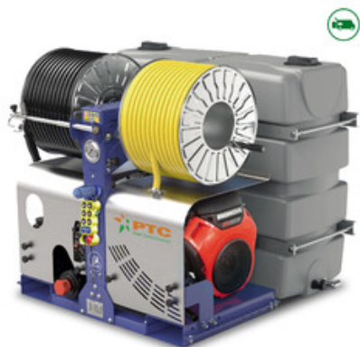
PTC Whale 55/160