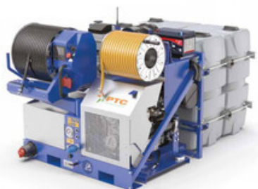
PTC Moses 60/200