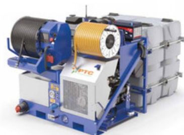
PTC Moses 30/300