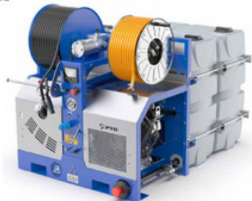
PTC Salmon 30/300