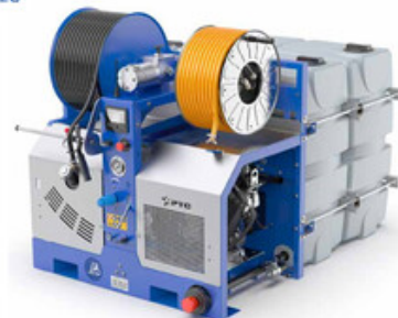
PTC Salmon 45/240