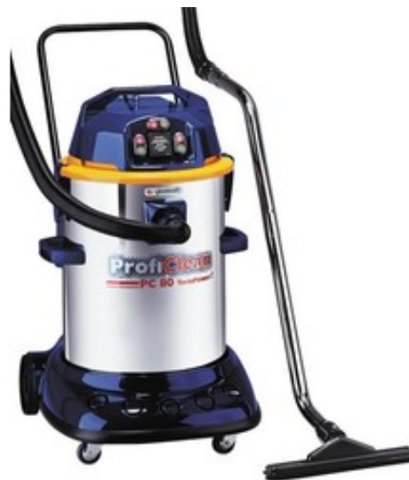
Gisowatt PC 80 TwinPower Inox