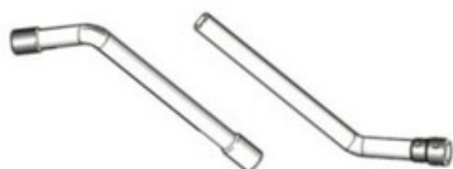
Sací trubky pro vysavače Gisowatt - nerez DN45