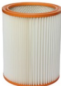
Filtrační patrona - válcový filtr Gisowatt PC 80 TwinPower, PC 90 TwinPower, PC 80TP Plastic