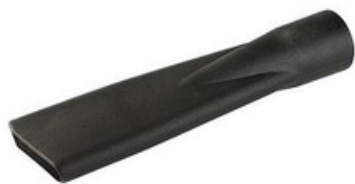
Štěrbínová hubice DN 45 pro vysavače Gisowatt