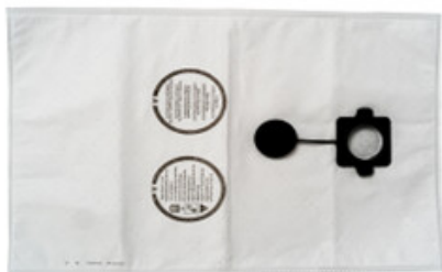
Filtrační sáčky Gisowatt PC 50 - PC 80 "M" fleece (5ks)