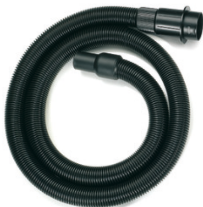
Kompletní sací hadice pro vysavače Gisowatt - 2.3m DN45