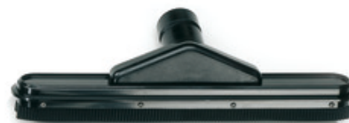
Průmyslová podlahová hubice pro mokré vysávání Gisowatt DN45