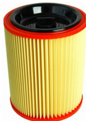
Filtrační patrona - válcový filtr s držákem Gisowatt PC 80 TwinPower, PC 90 TwinPower, PC 80TP Plastic