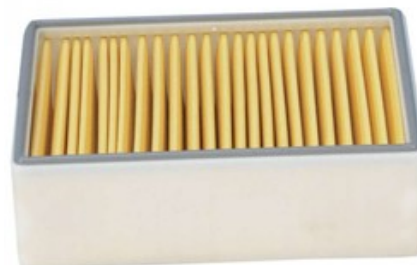
Hepa filtr Gisowatt PC 80 TwinPower, PC 90 TwinPower, PC 80TP Plastic