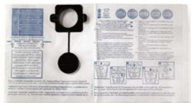
Filtrační sáčky Gisowatt PC 70, PC 80 Plastic (5ks)