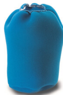
Vodní filtr pro vysavače Gisowatt - velký