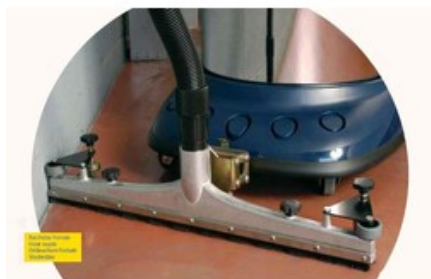
Velkoprostorová sací hubice pro vysavače Gisowatt DN45