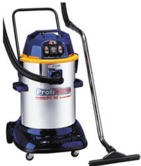
Gisowatt PC 90 TwinPower Inox