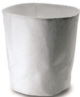
Filtrační vak Gisowatt PC 80 - PC 90 TwinPower