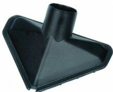
Trojúhelníková sací hubice Gisowatt DN 45