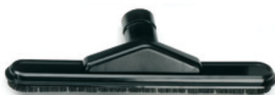
Průmyslová podlahová hubice se štětiniami Gisowatt DN45