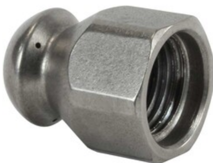
Vysokotlaká kanalizační tryska 250bar 1/4" ST-49 5+1 (110)