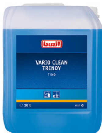
Buzil Vario Clean Trendy T 560 (10L)