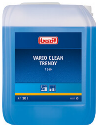
Buzil Vario Clean Trendy T 560 (10L)