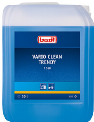
Buzil Vario Clean Trendy T 560 (10L)