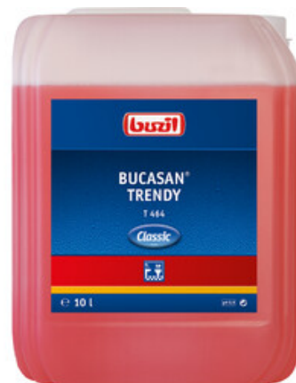
Buzil Bucasan Trendy T 464 (10L)