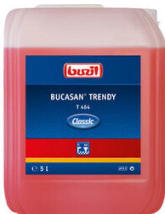
Buzil Bucasan Trendy T 464 (5L)