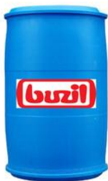
Buzil Bucasan Trendy T 464 (200L)