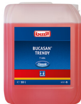
Buzil Bucasan Trendy T 464 (10L)