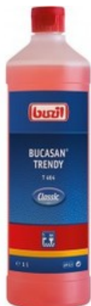
Buzil Bucasan Trendy T 464 (1L)