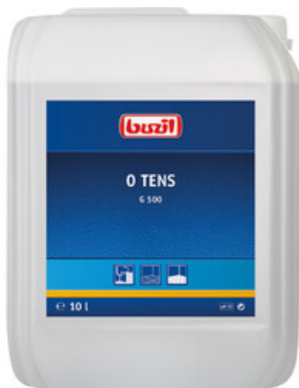
Buzil O Tens G 500 (10L)