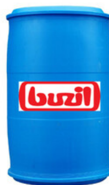
Buzil O Tens G 500 (200L)