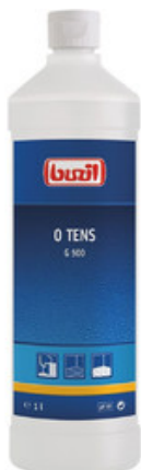
Buzil O Tens G 500 (1L)