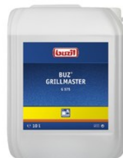
Buzil Grillmaster G 575 (10L)