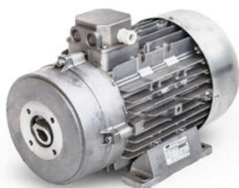
Elektromotor Mazsoni MEC 132 MMD 11kW 1450ot/min 400/700V