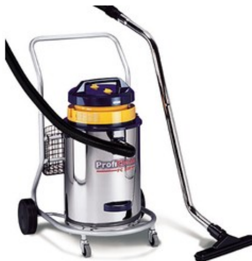
Gisowatt PC 70R