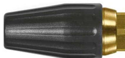
Vysokotlaká rotační tryska ST-357 055 (250bar)