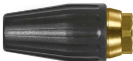
Vysokotlaká rotační tryska ST-357 045 (250bar)