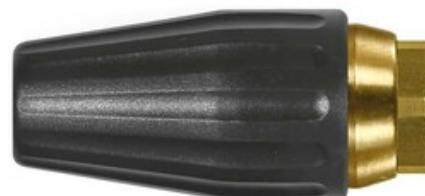
Vysokotlaká rotační tryska ST-357 040 (250bar)