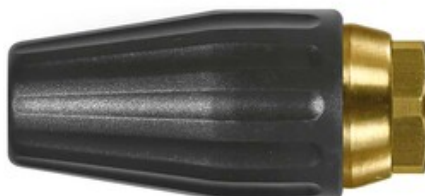
Vysokotlaká rotační tryska ST-357 035 (250bar)