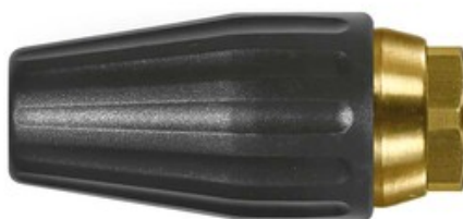
Vysokotlaká rotační tryska ST-357_090 (250bar)