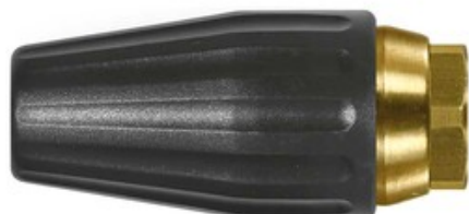
Vysokotlaká rotační tryska ST-357 030 (250bar)