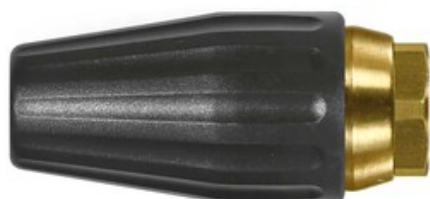
Vysokotlaká rotační tryska ST-357 060 (250bar)