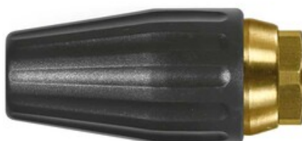
Vysokotlaká rotační tryska ST-357 065 (250bar)