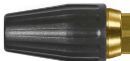
Vysokotlaká rotační tryska ST-357 070 (250bar)