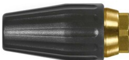
Vysokotlaká rotační tryska ST-357 050 (250bar)