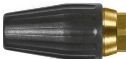
Vysokotlaká rotační tryska ST-357 055 (250bar)