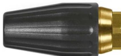
Vysokotlaká rotační tryska ST-357 040 (250bar)