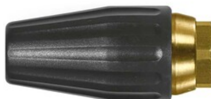
Vysokotlaká rotační tryska ST-357 070 (250bar)