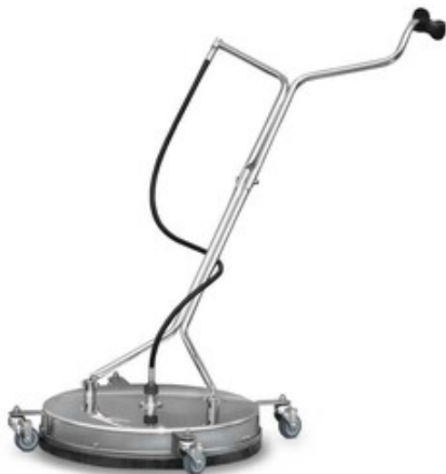
Rotační čistič ploch pro vysokotlaké čističe TD520 Basic