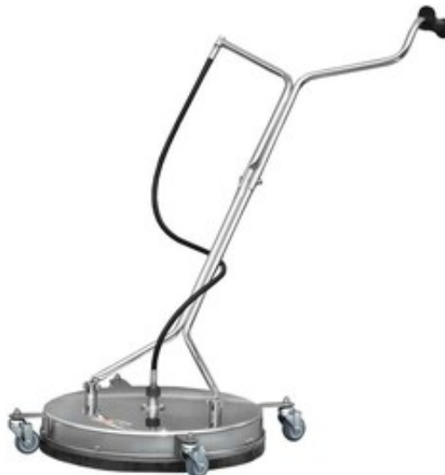
Rotační čistič ploch pro vysokotlaké čističe TD520 Industrial