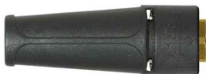
Vysokotlaká tryska Vario 1/4\" data-bbox="76 793 334 825"/>