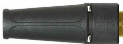
Vysokotlaká tryska Vario 1/4\" data-bbox="76 326 334 359"/>