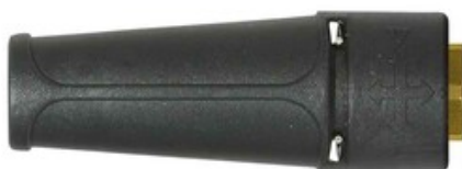
Vysokotlaká tryska Vario 1/4\" data-bbox="359 561 617 592"/>