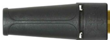
Vysokotlaká tryska Vario 1/4\" data-bbox="641 326 898 359"/>