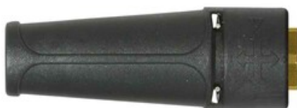
Vysokotlaká tryska Vario 1/4\" data-bbox="359 326 617 359"/>