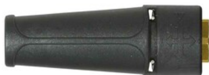
Vysokotlaká tryska Vario 1/4\" data-bbox="76 561 334 592"/>