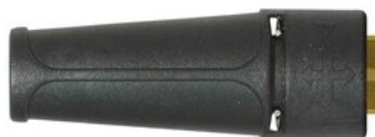
Vysokotlaká tryska Vario 1/4\" data-bbox="641 561 898 592"/>