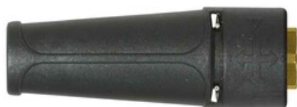
Vysokotlaká tryska Vario 1/4\"/> 045