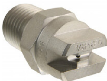
Vysokotlaká tryska plochá 1/8" 25020